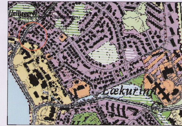
Úrdráttur úr aðalskipulagi Hafnarfjarðar

Kvöð er um aðkeyrslu að bílskúr Hverfisgötu 4b um lóðina Hverfisgötu 6b. Kvöð er um aðkeyrslu að bílskúr Hverfisgötu 6b um lóðina Hverfisgötu 4b.